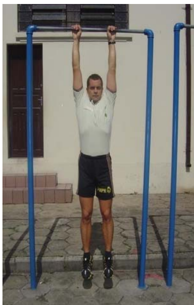
Figura 2 – Posição inicial 1 e, posição final 3.

www.mallet.pr.gov.br mallet@mallet.pr.gov.br