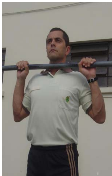
Figura 3 – Posição 2 intermediária.